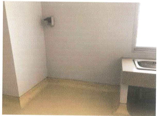
พื้นที่สำหรับติดตั้งครุภัณฑ์ ตู้ดูดไอระเหยฯ

บริเวณที่ติดตั้งตู้เก็บสารเคมี และตู้ดูดไอระเหยตัวทำลาย ตามรูปภาพแนบท้าย ให้เว้นพื้นที่ส่วนนี้ในแบบแปลนที่จะนำเสนอ เนื่องจากเป็นรายการครุภัณฑ์ที่ไม่อยู่ในรายการ ครุภัณฑ์ประกอบห้องควบคุมคุณภาพสารมาตรฐานสมุนไพรมาน จำนวน 1 ชุด โดยวิธีประกวดราคาอิเล็กทรอนิกส์ (e-bidding) ครั้งที่ 26/2565