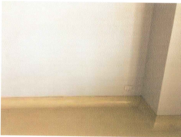
พื้นที่สำหรับติดตั้งครุภัณฑ์ ตู้เก็บสารเคมี

ตามที่คณะเภสัชศาสตร์ มหาวิทยาลัยสงขลานครินทร์ ได้รับอนุมัติให้จัดซื้อครุภัณฑ์ รายการ ครุภัณฑ์ประกอบห้องควบคุมคุณภาพสารมาตรฐานสมุนไพรมาน จำนวน 1 ชุด โดยวิธีประกวดราคาอิเล็กทรอนิกส์ (e-bidding) เลขที่ 26/2565 วงเงินงบประมาณ 950,000.-บาท (เก้าแสนห้าหมื่นบาทถ้วน) โดยเบิกจ่ายจากเงินงบประมาณ งบลงทุน ประเภทค่าครุภัณฑ์ ผลผลิต : ผู้สำเร็จการศึกษาด้านวิทยาศาสตร์สุขภาพ แผนงาน : พื้นฐานด้านการพัฒนาและเสริมสร้างศักยภาพคน ของคณะเภสัชศาสตร์ ประจำปีงบประมาณ 2565 และกำหนดการขอรับเอกสาร เริ่มตั้งแต่วันที่ 15 - 27 ธันวาคม 2564 ผู้เสนอราคาต้องเข้าสำรวจ และประเมินพื้นที่ติดตั้ง และรับทราบรายละเอียดเงื่อนไขการปรับปรุงสถานที่ ณ อาคาร 6 ชั้น 7 ในวันที่ 24 ธันวาคม 2564 เวลา 09.30 – 10.30 น. คณะเภสัชศาสตร์ นั้น ทางคณะฯ ขอแจ้งรายละเอียดการเข้าดูสถานที่ ดังนี้ รายละเอียดเพิ่มเติมภายในห้อง