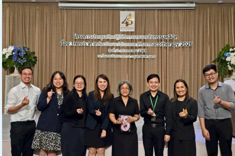
โครงการประชุมเชิงปฏิบัติการงานเภสัชกรรมคลินิก เรื่อง Trends in Infectious Disease Pharmacotherapy 2026 วันที่ 12-16 มกราคม 2569 ณ โรงแรมใบหยกสกาย กรุงเทพมหานคร